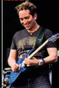
JOHN MCLAUGHLIN & THE 4TH DIMENSION