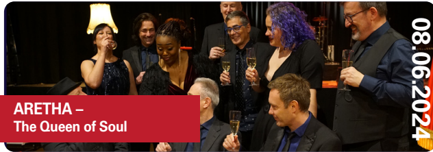
ARETHA – The Queen of Soul