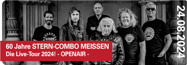
60 Jahre STERN-COMBO MEISSEN Die Live-Tour 2024! - OPENAIR -