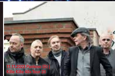
11.11.2023 Pantow (D) | Kille Kille 40+ tour 23