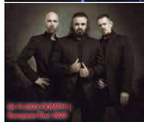
04.11.2023 OJIMPE | European tour 2023