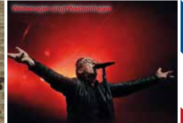
Wahrensagen singt Westerntage