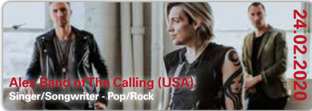
Alex Band of The Calling (USA) Singer/Songwriter - Pop/Rock