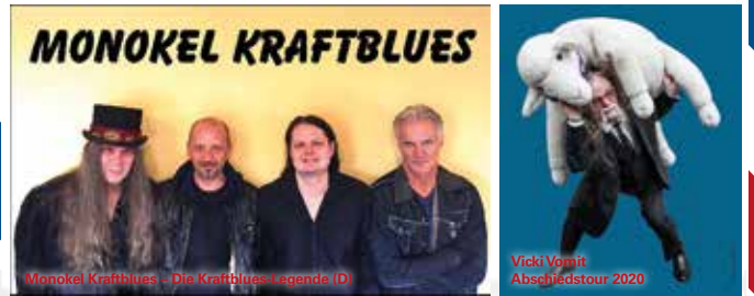
Monokel Kraftblues - Die Kraftblues Legends (D)