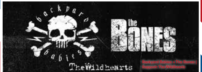
Backyard Babies + The Bones | Support: The Wildhearts