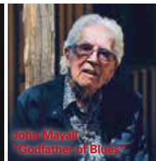
John Mayall "Godfather of Blues"