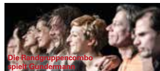
Die Randgruppencombo spielt Guldemann