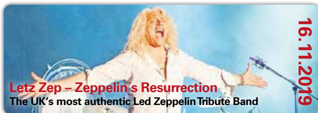
Letz Zep – Zeppelin's Resurrection The UK's most authentic Led Zeppelin Tribute Band