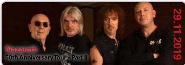
Nazareth 50th Anniversary Tour - Part II