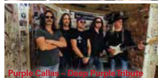
Purple Callas – Deep Purple Tribute