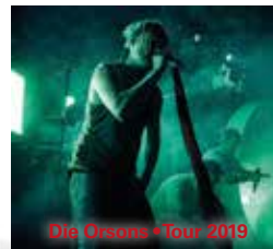
Die Dooms - Tour 2019