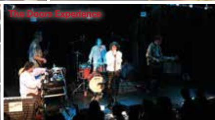
The Doors Experience