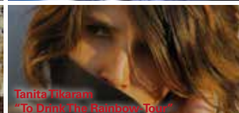
Tanita Tikaram "To Drink The Rainbow Tour"