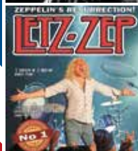
ZEPPELIN'S RE-IMAGINATION! LED ZEP