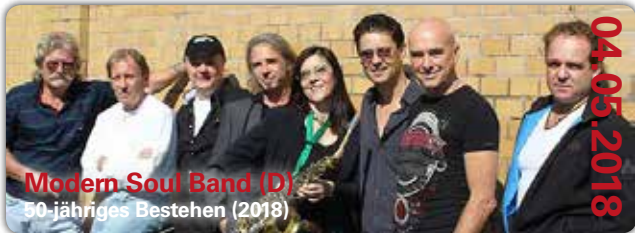
Modern Soul Band (D) 50-jähriges Bestehen (2018)