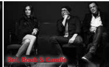
Bell, Book & Candle