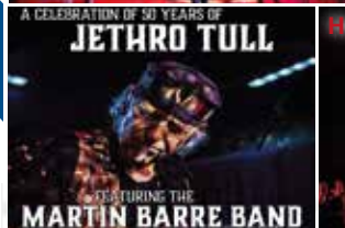
A CELEBRATION OF 50 YEARS OF JETHRO TULL FEATURING THE MARTIN BARRE BAND