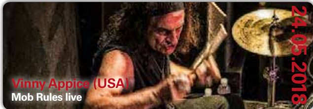
Vinny Appice (USA) Mob Rules live