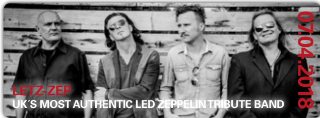
LETZ-ZEP UK'S MOST AUTHENTIC LED ZEPPELIN TRIBUTE BAND