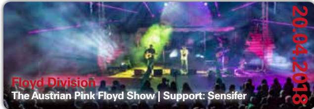
Floyd Division The Austrian Pink Floyd Show | Support: Sensifer