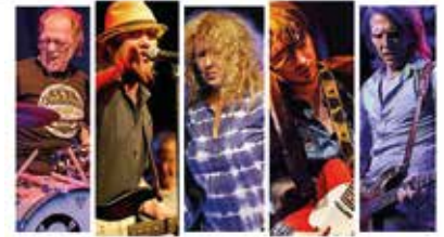
THE HAMBURG BLUES BAND feat MAGGIE BELL