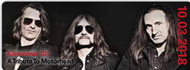
Kilminster (D) A Tribute To Motörhead