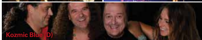
Kozmic Blue (D)