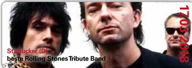
Starfucker (D) beste Rolling Stones Tribute Band