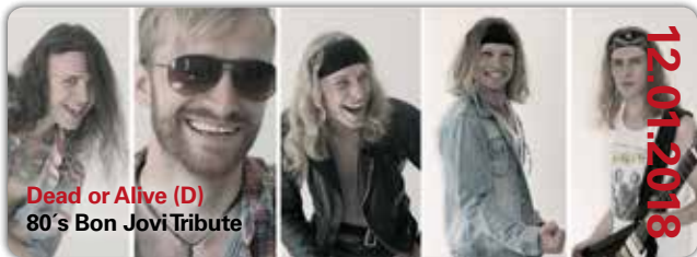
Dead or Alive (D) 80's Bon Jovi Tribute