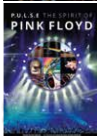
B3 - Mix aus Jazz, Rock, Funk und Blues