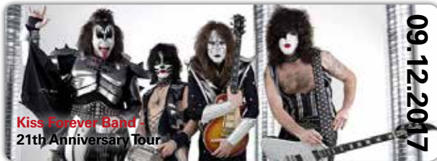
Kiss Forever Band - 21th Anniversary Tour