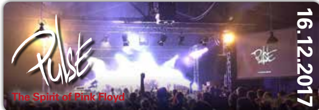
The Spirit of Pink Floyd